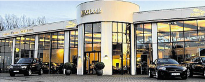
Klasse Ambiente, für ein Klasse Auto: Das Jaguar House Nehrkorn an der Liebigstraße 1.