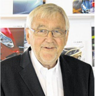
Bernd Nehrkorn ARCHIV