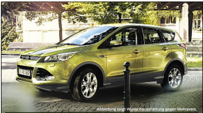
Abbildung zeigt Wunschausstattung gegen Mehrpreis.